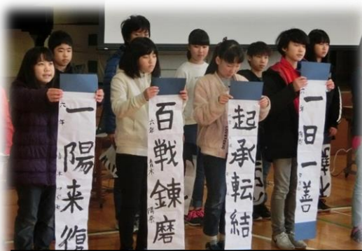
6年生は、今年の決意・めあてを四字熟語で発表しました

さて、いよいよ3学期です。先程は、1年生、6年生が代表して発表してくれました。めあてをしっかりとっていましたね。