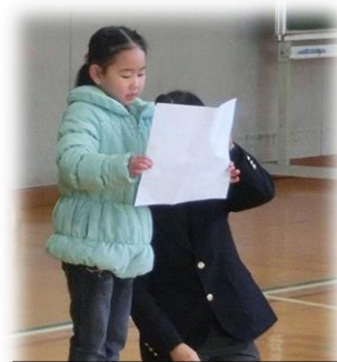
1年生は、全校の前で大きな声で、3学期のめあてを発表しました。

2学期終業式で胡蝶蘭(こちょうらん)の芽の話をしました。今日も「め」の話です。先生は、冬休みに学校の周りを歩いていてまたまた発見をしました。桜の木は、寒くてお休みしているかと思ったけれど、近くに行ってみると、もう新しい芽が出ていました。本で調べたら、芽の中にはこれから葉や花になるものが小さくたたまれていて春を待っているそうです。夏の間につくられた強い体で寒さにたえて、春になると木も少し大きくなって、前の年よりもたくさんの花を咲かせるそうです。中庭のあじさいにも、もう新しい芽がでていました。次の花を咲かせるために、もうしっかり準備をしているんですね。