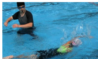
夏休み、プールでたくさん泳ごう！

特に交通安全に注意して、『絶対に飛び出しをしないこと』を守ってください。安全で楽しく、「これだけはがんばった」と思える夏休みにしましょう。そして、8月23日の二学期の始業式には、元気な皆さんに会えるのを楽しみにしています。