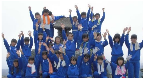
5年 自然体験学習 根子岳頂上で

さて、皆さんもニュースを見て知っていると思いますが、大雨が降って、家を流されたり、亡くなってしまわれたり、家族を失ったり、学校へ行かれない、家に帰れないなど大変な思いしている方々が大勢います。心からお見舞いを申し上げます。