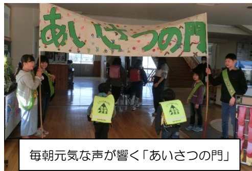
毎朝元気な声が響く「あいさつの門」

ここでは、代表で3年敬組のアンケートの結果を発表します。全員が「あてはまる(よくできた)」と答えていると花が10個咲くことにします。では、「考え合い 伝え合い 学び合う」の中でも「先生や友だちの話から自分の意見や考えを持つことができた」は、なんと9個、「明るい挨拶」は8個、「無言で清掃」も8個の花が咲きました。1学期よくがんばりました。皆さんは、どの目標が一番がんばれましたか？